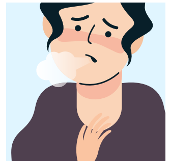
ពិបាកដកដង្ហើម